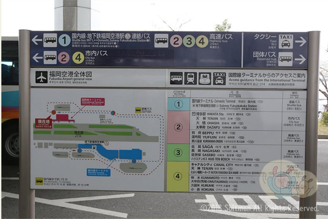
국제선에서 나오면 보이는 버스 승차표